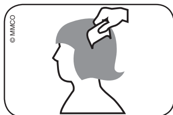
Fig. Peínese el cabello mojado con el peine para piojos: desde la raíz hasta las puntas del cabello